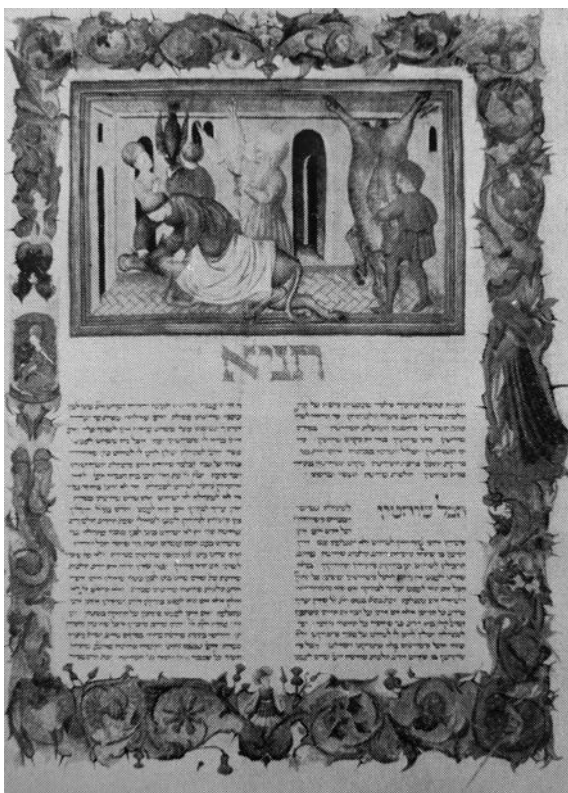
Fig. 1. Miniatura raffigurante l'ispezione rituale delle carni bovine e di volatili dopo la mattazione. Biblioteca Apostolica Vaticana, Cod. Ross. 555, f. 127v.

due – i soli capi bovini e ovini, in pratica – e il pollame, sia consentito cibarsi solo se siano stati sottoposti alla shechitah , eliminando il nervo sciatico, il sangue e il grasso mediante un coltello molto affilato. Oltre allo scarto dei consistenti residui, il rituale comporta l'esclusione dal consumo di quei capi che non siano stati trovati perfettamente sani al momento della visita veterinario-rituale ( bedikah ) 4 successiva alla mattazione (fig. 1).