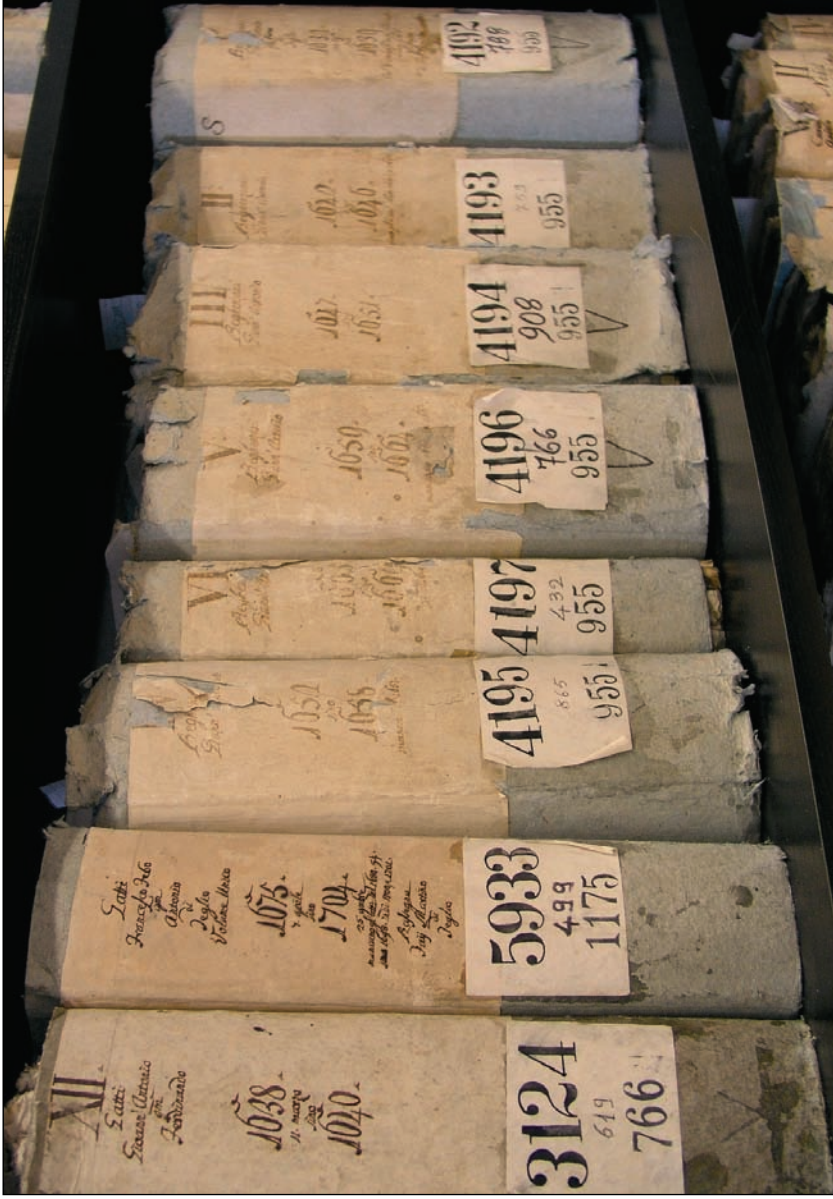
Fig. 2. Buste di epoca napoleonica in carta cenerina con dorsi scritti in inchiostro bruno dagli addetti all'archivio, i quali « hanno l'incombenza di apporre al dorso delle abbreviature le epoche de rogiti che contiene ciascun tomo notarile » (AS SO, AN, b. « Normali Archivio e Camera », fasc. « 1810 ») foto U. Zecca.