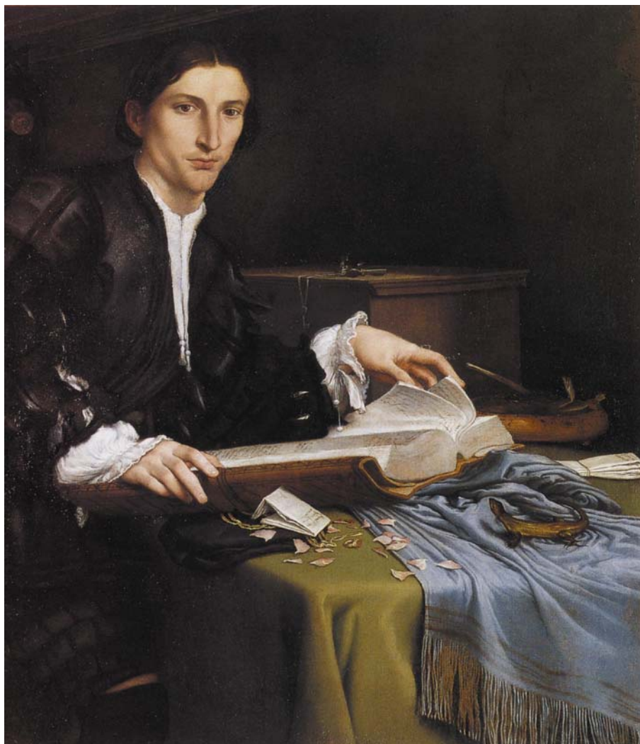
Fig. 3. Lorenzo Lotto, Ritratto di giovane nello studio , circa 1528, particolare, Venezia, Gallerie dell'Accademia.

Attorno al giovane pensoso, i segni dell'archivio e delle scritture: i documenti assieme ai gioielli e ai sacchetti di monete, il registro contabile dalla caratteristica legatura, la cassella da scritture con la chiave, gli strumenti per scrivere e per sigillare.