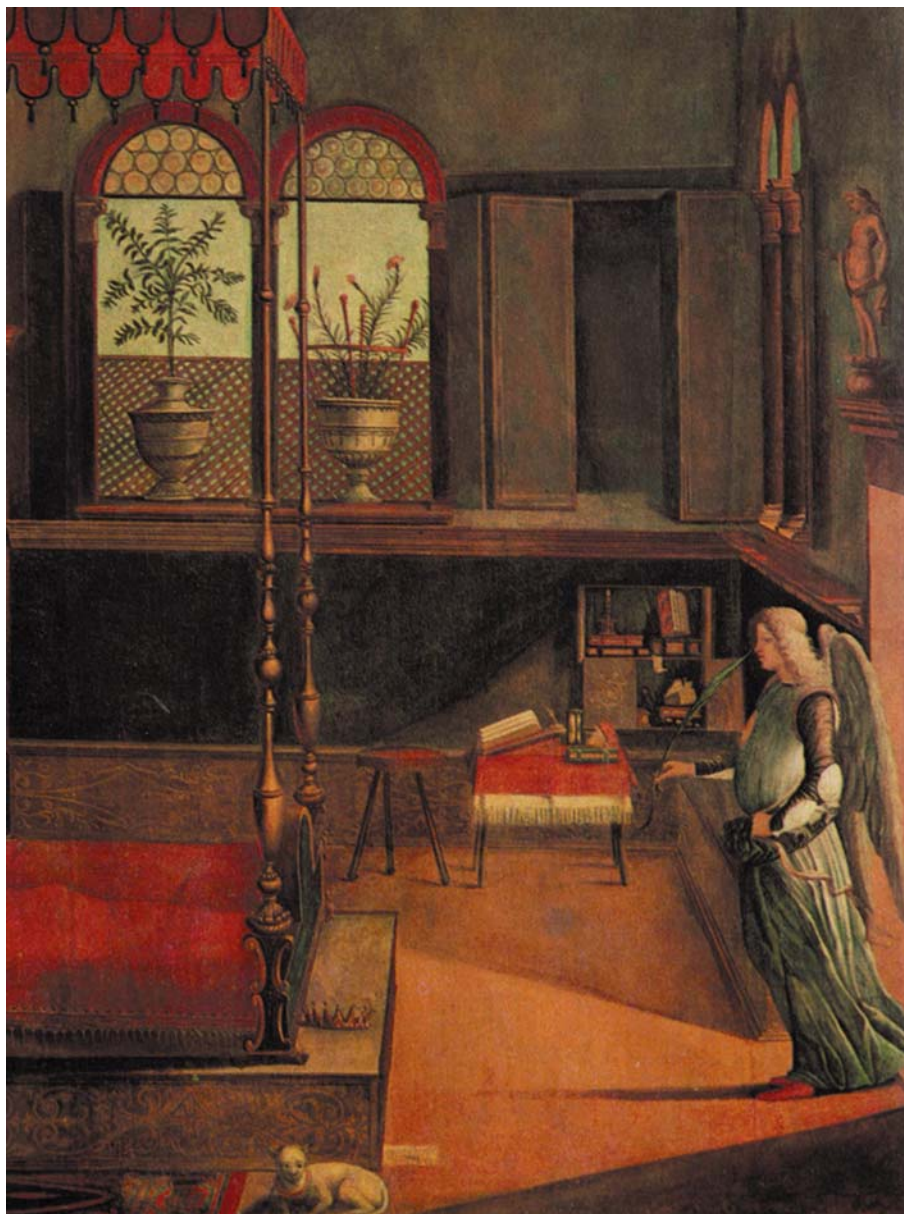
Fig. 2. Vittore Carpaccio, Il sogno di Orsola , 1495, particolare, Venezia, Gallerie dell'Accademia. Interno veneziano della fine del Quattrocento, con lo studiolo come zona interna della camera da letto.